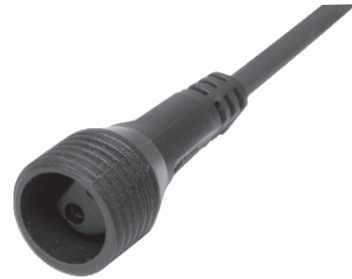
figure 2. • 2. ábra • 2. obraz • figura 2. • 2. skica • 2. obrázek • 2. slika